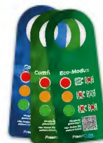
3x Ampelhänger Farberklärung